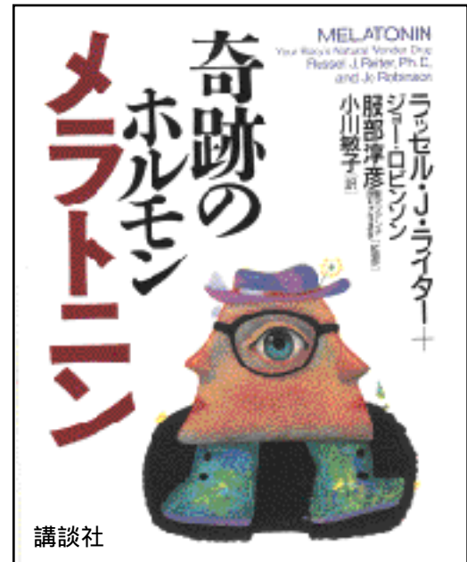
メラトニン紹介の本

つまりメラトニンを錠剤で毎晩飲むことで、老化現象やストレスによって不足する大切な必要物質を補うわけです。